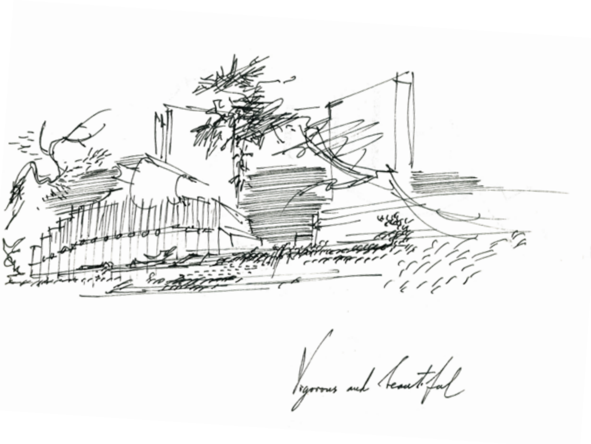
SKICA: EDVARD RAVNIKAR »ŽIVO IN LEPO«, OUTSIDER #28,